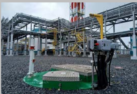
Производство и поставка 30-и комплектных КНС ПАО "СИБУР Холдинг" Западно- Сибирский Нефтехимический комбинат Г. Тобольск